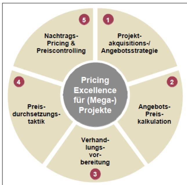
Abbildung 1: Pricing Excellence-Ansatz für (Mega-)Projekte

Diese Grafik ist übersichtlich, gut strukturiert und in einem Farbschema gehalten. So ähnlich könnten auch die Grafiken zu Ihrem Beitrag aussehen.